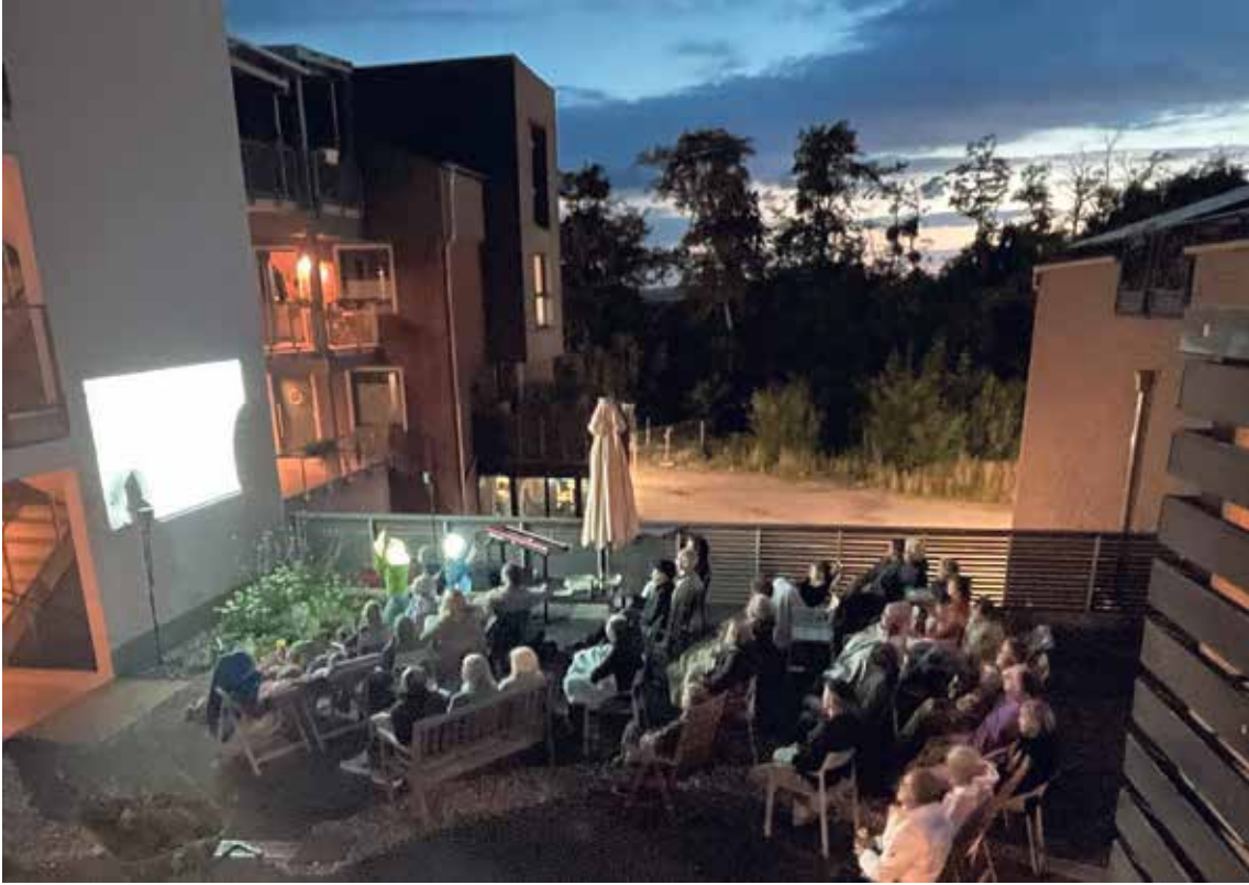
Miteinander statt nebeneinander: Im PrymPark trifft sich die Haus- gemeinschaft beim Open-Air-Filmabend oder zum Kickerspielen beim Nach- barschaftsfest